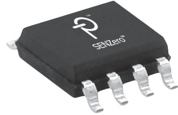
SO-8 (D 封裝)